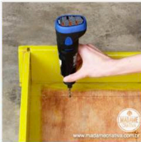
Micro retífica Dremel, 10000 a 20000 rpm, 7,2V