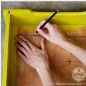
Gaveta sendo preparada para virar um organizador de jóias, bijuterias e acessórios femininos.

All 5 Melhores Acompanhamentos Ano Novo Aperitivos Arame E Metal Artesanato Bebidas E Refrescos Biscoitos Bolos E Cupcakes Casamentos Comida Saudável Criança Curte Datas Comemorativas Dia Dos Namorados Ferramentas Festa Junina Festas Tematicas60e1d8e718 Iluminação Madame Criativa Madeira Materiais Diversos Material Reciclado Molhos E Patês Móveis Natal Objetos Decorativos Organização